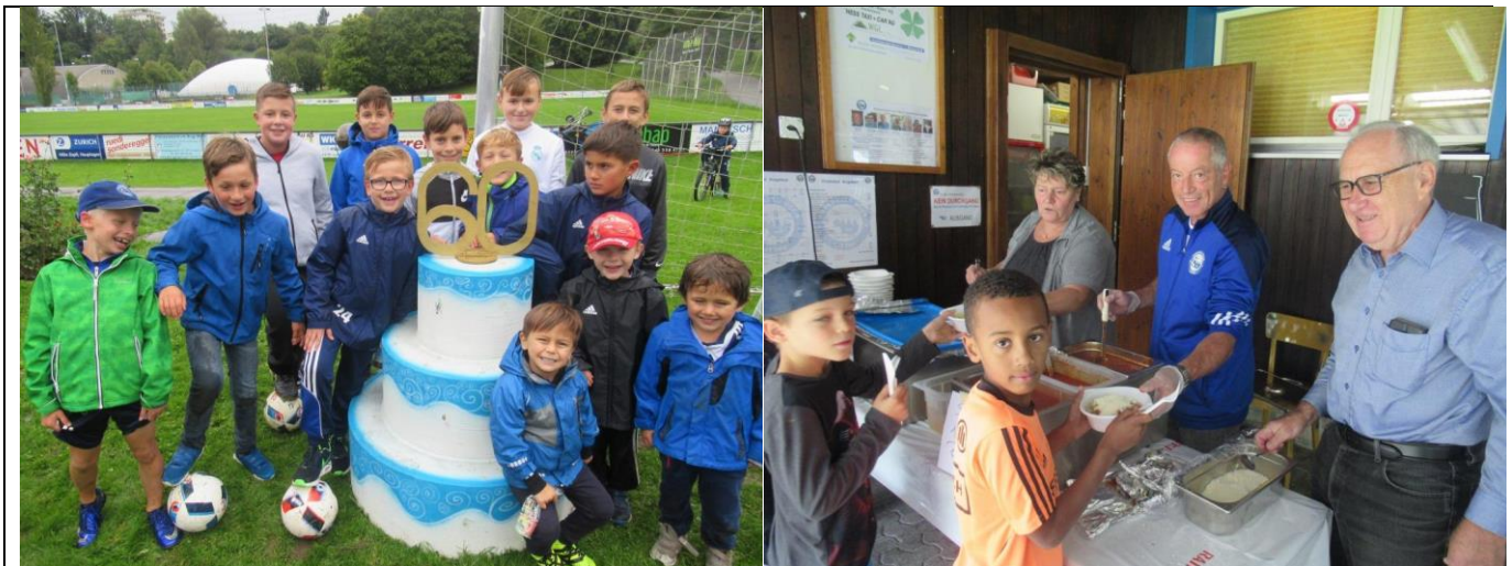
Die Jüngsten des FC Littau hatten alle sichtlich Spass und Freude am Sport-und Familientag am 17. September 2017 und nahmen die Geburtstags-Torte zu „60 Jahre FC Littau 2017“ auf ihre eigene Art in Beschlag.

Dank dem Anerkennungspreis der Albert Koechlin-Stiftung im Jahre 2011 für „FC Littau – Integration durch Sport“ genossen die Anwesenden einen kostenlosen Sport- und Familien-Tag.