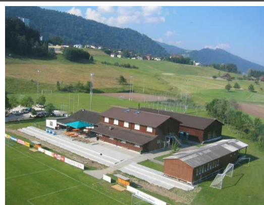
Sportplatz Ruopigenmoos: Seit 1977 das neue Zuhause des FC Littau.