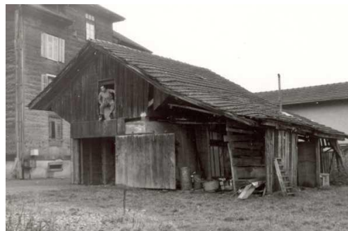
Garderobe bis 1967 Holzschof hinter dem Rest. Thorenberg. Der obere Stock diente bis 1967 als Umkleiraum, ohne Heizung! Die Gäste mussten sich jeweils in der Kegelbahn umziehen. Im Hintergrund rechts.