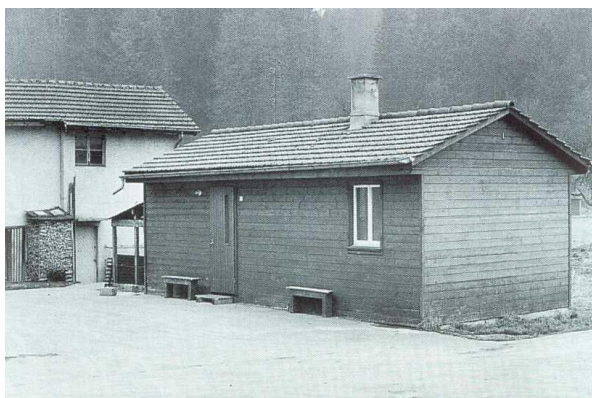
Garderoben-Neubau 1967. Im Hintergrund die Türe zu umgebauten Dusche unter der Kegelbahn